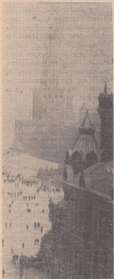
Москва. Вид на Красную площадь.